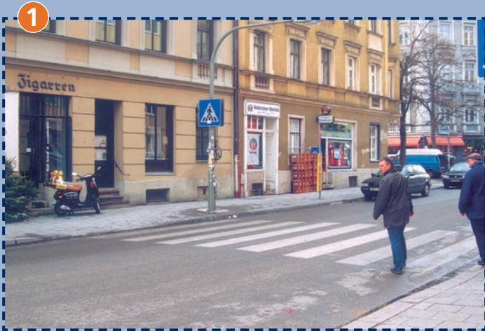
Zebrastrreifen in der Westermühlstraße (oft zugeparkt)