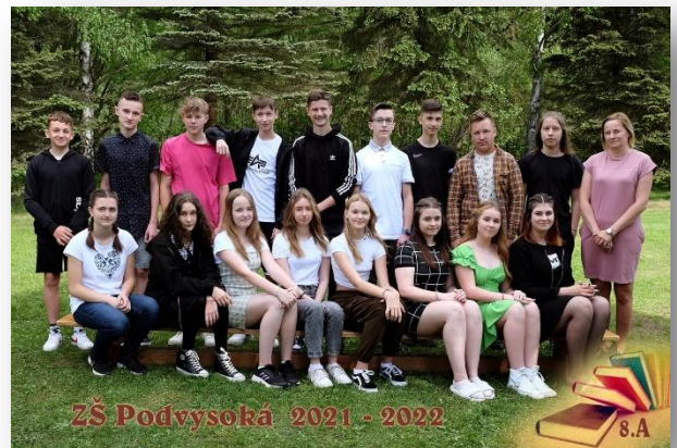
ZŠ Podvysoká 2021 - 2022