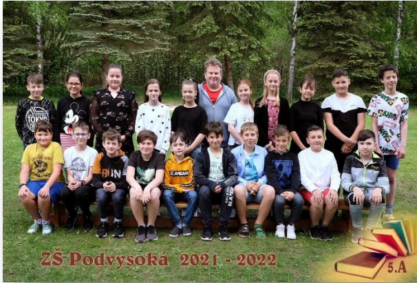
ZŠ Podvysoká 2021 - 2022