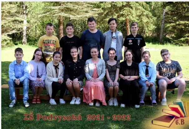
ZŠ Podvysoká 2021 - 2022