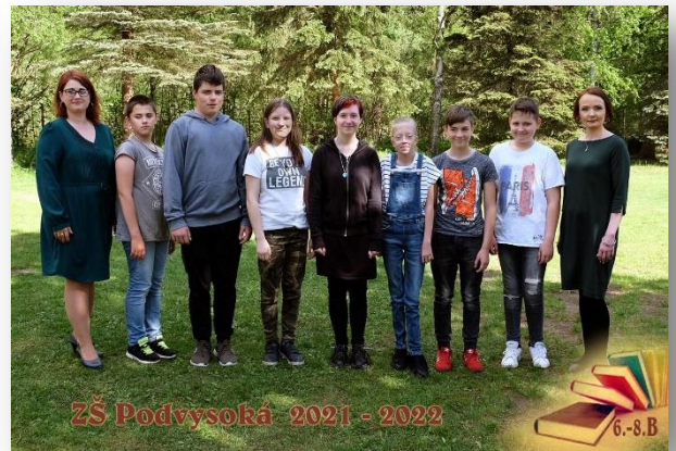
ZŠ Podvysoká 2021 - 2022