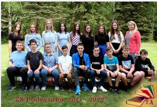
ZŠ Podvysoká 2021 - 2022