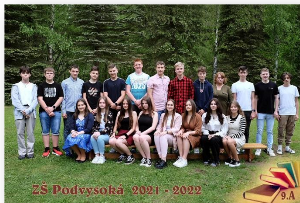
ZŠ Podvysoká 2021 - 2022