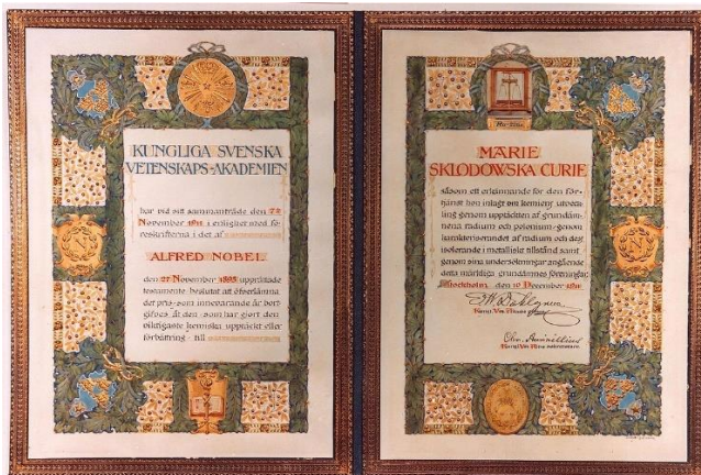
Dyplom Nobla z 1911r dla Marii Skłodowskiej-Curie

Trochę wiedzy i historii o nagrodzie Nobla