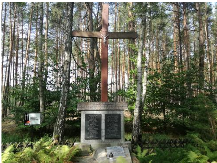
Pod dębowym krzyżem napis:

„Grób Polaków zamordowanych przez hitlerowców dnia 26 października 1939r.”