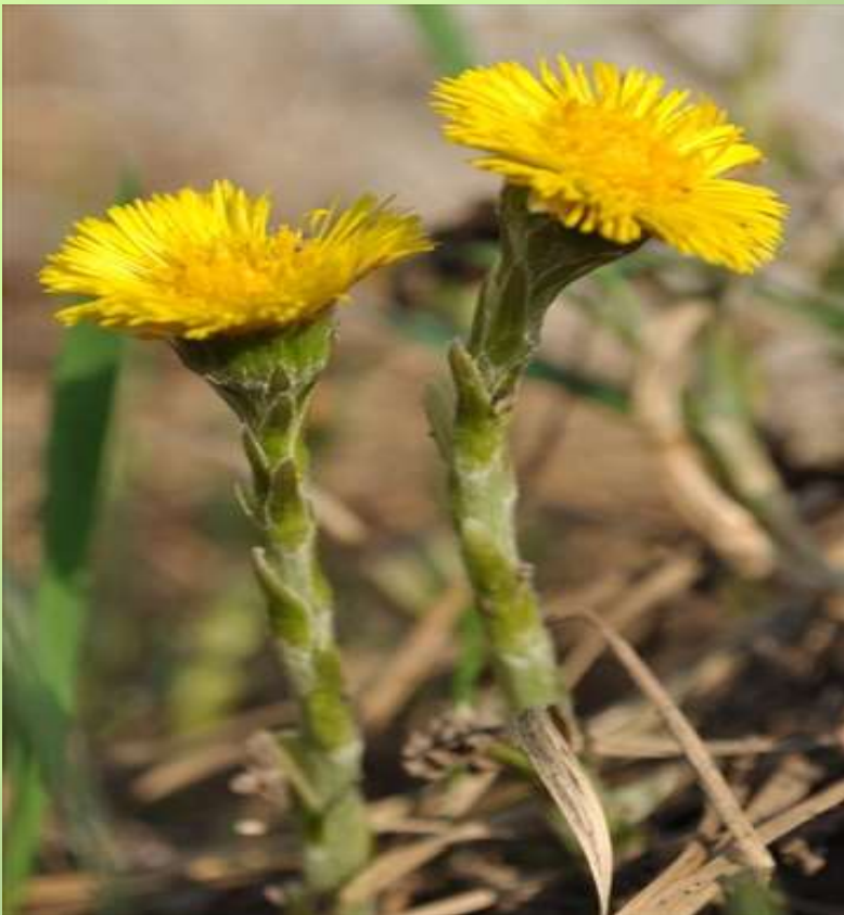
Tussilago farfara; Asteraceae