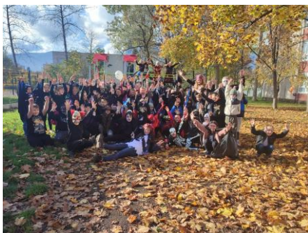
Halloween v EduKey