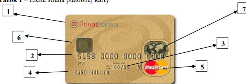
Obrázok 1 – Lícna strana platobnej karty

Na lícnej strane sa nachádza: 1. Názov a logo banky, ktorá platobnú kartu vydala, 2. 16-miestne číslo platobnej karty- prvé dve čísla identifikujú druh karty, (napr. VISA začína vždy 4), ďalších päť číslíc vydavateľa karty, zbytok je učený pre identifikáciu konkrétneho držiteľa, 3. obdobie platnosti platobnej karty- obdobie kedy je možné kartu používať, 4. meno držiteľa platobnej karty, 5. názov a logo medzinárodnej bankovej asociácie, 6. čip- ak sa jedná o čipovú kartu, 7. ochranný prvok- napr. hologram ( laserom vytvorený obraz ) – nemusia ho obsahovať všetky karty.