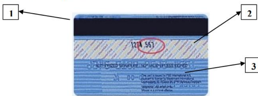
Obrázok 2: Rub platobnej karty

Platobná karta - je majetkom banky, ktorá ju vydala a preto peňažné ústavy väčšinou požadujú jej vrátenie po skončení doby splatnosti. Umožňuje majiteľovi prístup k peňažným prostriedkom prostredníctvom bankomatov 24 hodín denne, platiť bezhotovostne v obchodoch a uskutočňovať finančné transakcie cez internet.